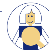
Illustration by KINGA DARSOW